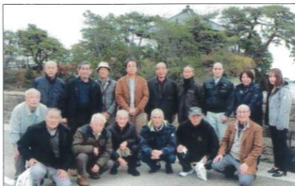
松島五大堂前にて記念撮影

研修の後は松島海岸へ移動した。昼食は盛り沢山の刺身・牛タンなどに満足した。久しぶりの松島はインバウンドで観光遊覧船客や土産屋さんで大変混んだ。予定通り16時過ぎに無事到着解散した。