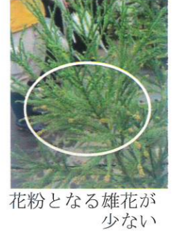
花粉となる雄花が少ない

令和6年度 生産森林組合連絡協議会実務研修会 日時 令和6年11月22日(金) 場所 宮城県林業技術総合センター(大衡村)