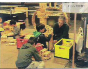
「ズレンガ」コーナー