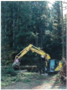
伐採した杉枝集める

松川は、刈田岳山頂付近に発する澄川などから流下する濁川が遠刈田温泉の西で合流。円田・曲竹・宮の各地区を東南流して白石川と合流する。全長約20キロ。松川に架かる橋の架け替え工事が行われていた。この工事に伴い周辺に育つ50年物の杉の木が新しい橋の開設に支障を来すため伐採作業である。