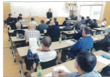
第1区 角田地区で開催

参与員の主な役割と任期満了を間もなく迎える総代選挙についての説明会議が開催されました。