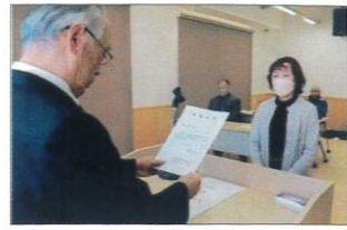
水戸選挙管理者からの当選証書付与された

総代の立候補締切りを12月2日の午後5時で締め切った結果、定数通りであり無投票で当選になりました。