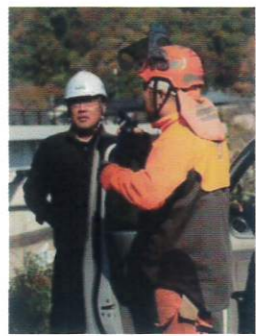
下請け会社と打合せ

経験豊富な2名の作業員を現場に派遣し、安全作業に配慮しながら伐採作業を行っていた。太さは約60センチ、高さは20メートルの杉の木をザウルスロボ使用して伐採する技は見事なものだ。しかも安全で効率が良い。処理される廃材は近くの産業廃棄物に運ばれて適正に処分される。